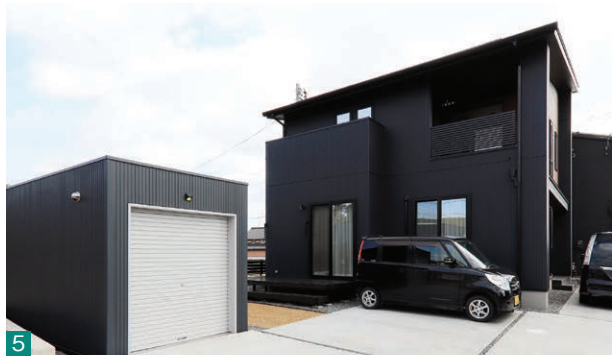
写真手前は、ご主人念願のバイクガレージ。広さは約6帖。新居のヴィンテージ風の外観に合わせ、同素材のブラックの外壁を採用した

「イシンホーム」ならではの地中熱を利用した換気システム「エコ・アイ工法」のおかげで、新居で迎えた初めての冬は、エアコン1台で足元から暖かく快適に過ごせています。吹き抜けを通して2階までめぐりめぐるので、寒い冬の朝も布団から出るのがとても楽になりました。子どもが風邪を引きにくくなったのもありがたいですね。念願の新居で家族との時間を大切にしながら、趣味の時間も楽しみたいとわくわくしています！